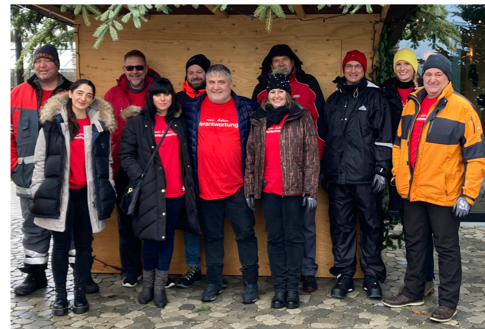
Foto: Strahlende Gesichter beim Team vom Audi Standort Münchsmünster beim Hollerhof nach erfolgreichem Abschluss des Weihnachtsmarktaufbaus.

Die Vorbereitungen für den Hollerhof-eigenen Weihnachtsmarkt sind im vollen Gang, da kam die Anfrage des Leiterteams des Audi Standorts Münchsmünster gerade recht: Ein Teil des Leiterteams vom Audi Standort Münchsmünster wollte an den tollen Erfolg des Audi weltweiten social day vom 13.06.2023 (bereits in Ausgabe fünf des Informationsblatts der Gemeinde Münchsmünster berichtet) gerne anknüpfen und sich mit weiteren sozialen Aktivitäten in Form eines Team-Projekts mit dem lokalen Partner Hollerhof engagieren.