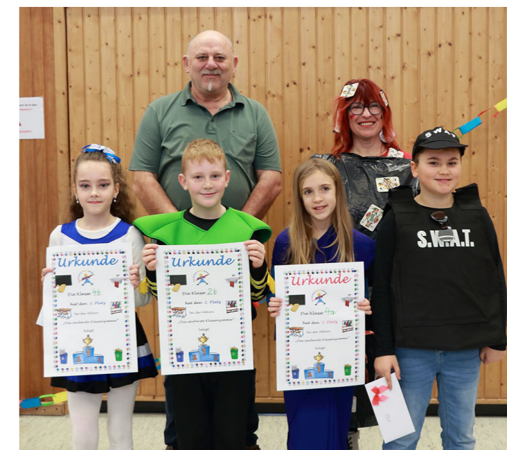
Die Gewinner des saubersten Klassenzimmers.

Und dann dröhnte es auch schon aus der Musikbox.