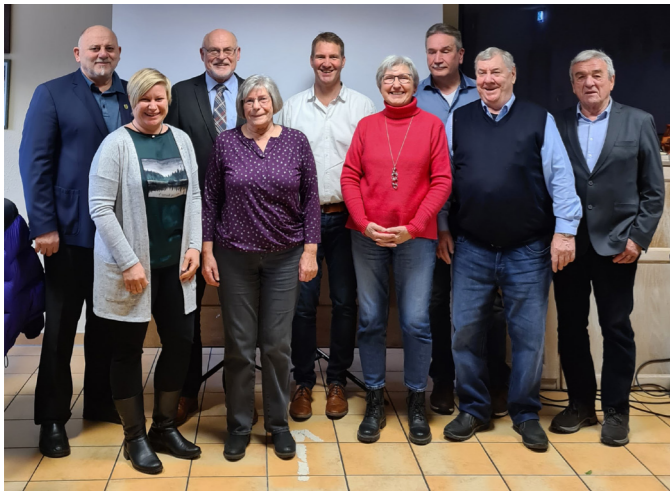
Vorstandschafft mit Bürgermeistern.

Vor allem Dingen beim Anteil der Kinder und Jugendlichen ist ein enormer Zuwachs zu verzeichnen. Anschließend folgten die Berichte aus den Abteilungen Fitness, Fußball, Leichtathletik, Stockschißen, Tischtennis, Radsport und mobile Senioren.