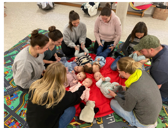
Die Freitagsgruppe der Eltern-Kind-Gruppe bei Bewegungsspielen mit ihren Kindern.

Wöchentlich treffen sich die insgesamt vier Gruppen der Eltern-Kind-Gruppe um gemeinsam zu spielen, zu singen, zu basteln und sich auszutauschen. Die Gruppe richtet sich dabei an Eltern mit Kindern zwischen 0-3 Jahren. Es werden neue Kontakte geknüpft, sich über Erziehungsfragen ausgetauscht, kindgerechte Beschäftigungen kennen gelernt und vieles mehr. Im Kellerraum des Rathauses hat die Gruppe ihren festen Platz mit Bällebad, Rutsche, Wippe, Küche und vielem mehr. Daneben finden die Gruppenstunden bei warmem Wetter regelmäßig draußen statt, wo die Kinder nach Herzenslust toben und spielen können. Fast schon obligatorisch sind die jährlichen Ausflüge unter anderem in den Vogelpark und mit dem Zug. Aktuell sind noch wenige Restplätze in der Mittwochsgruppe frei. Nähere Informationen erhalten Sie unter: www.eltern-kind-gruppe-muenchsmuenster.de