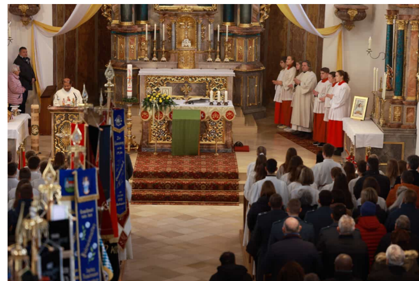
Mit einem feierlichen Gottendienst wurde die renovierte Kirche wieder eröffnet.

Im Anschluss an den Gottesdienst und Festakt gab es noch viele Gespräche bei einem kleinen Imbiss. bav