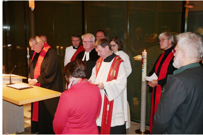
Gemeinsam beten Vertreter der evangelisch-lutherischen Kirchengemeinde Vohburg/ Geisenfeld und der katholischen Kirche die Fürbitten.

Bei dem anschließenden Festakt, moderiert von Dieter Stelzer vom Kirchenvorstand, sprachen viele Ehrengäste Gruß- und Dankworte. Dank sagten sie für die im Sinne gesellschaftlichen