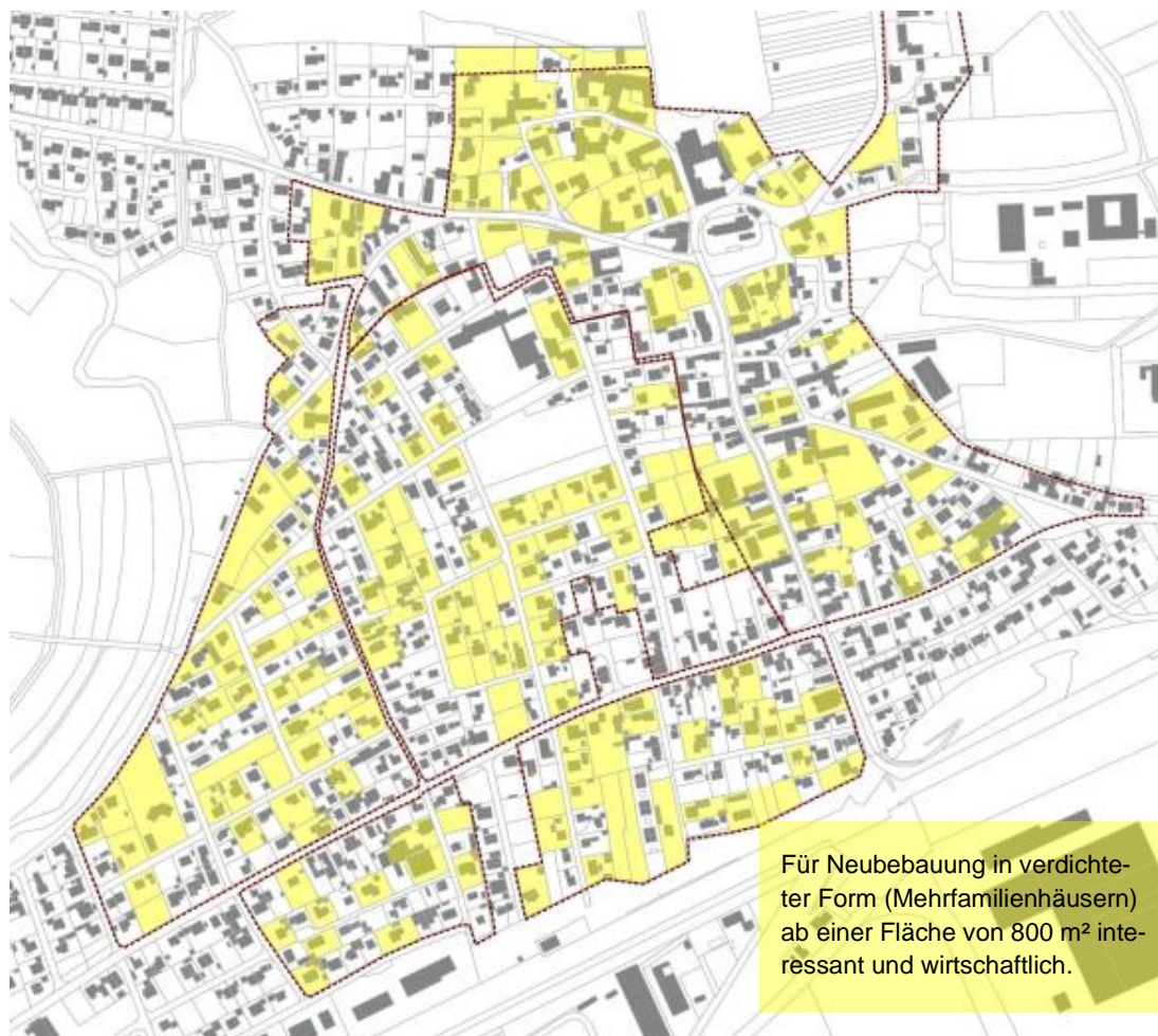
Abb. 4: Potentiale zur Nachverdichtung im Leerstand 3

Im Bereich der sog. „Ortsbebauungspläne“ Nr. 18 – 21 wurden einige unbebaute oder wenig ausgelastete Grundstücke ermittelt.