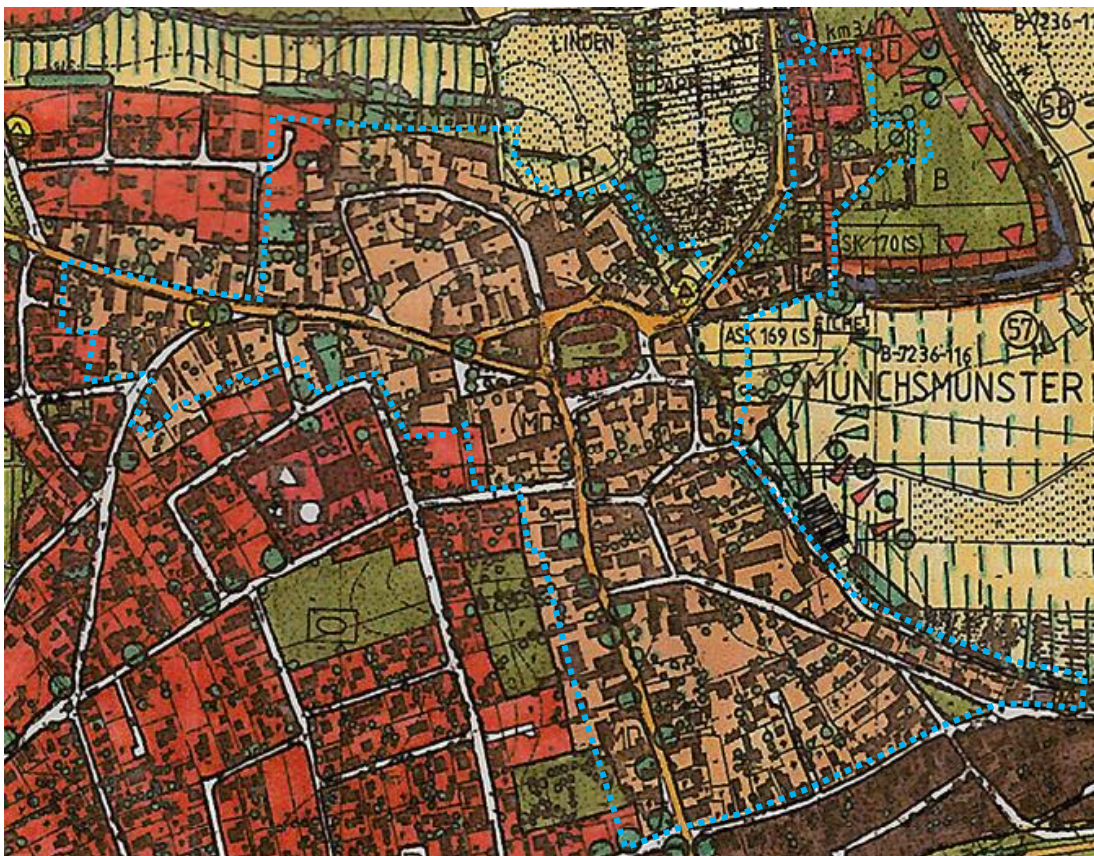
Abb. 3: Ausschnitt aus dem Flächennutzungsplan 3

Die Darstellungen des Flächennutzungsplans entsprechen nach wie vor der übergeordneten Zielvorstellung der Gemeinde zur Art der Bodennutzung. Da im vorliegenden einfachen Bebauungsplan die Art der Bodennutzung nicht geregelt wird, besteht auf Flächennutzungsplanebene kein Handlungsbedarf.