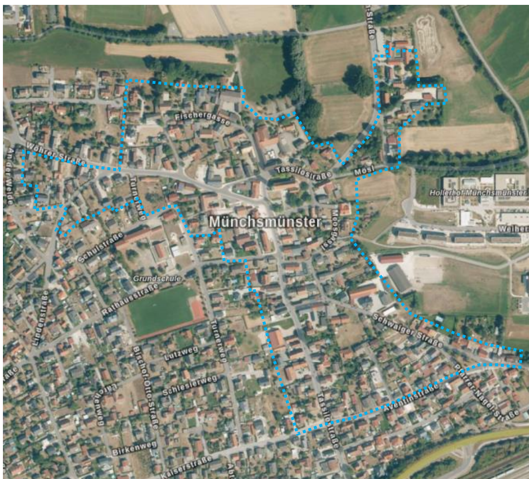
Abb. 1: Luftbild mit ungefährer Abgrenzung des Plangebiets 1

Die Siedlungsstruktur ist gekennzeichnet von den landwirtschaftlichen Hofstellen, giebelständig aufgereiht an der Tassilostraße und rund um die Kirche. Zu den Hofstellen gehören Hofflächen, und im rückwärtigen Bereich Scheunen und weitere Nebengebäude, Gärten und Gehölzstrukturen. Die Erschließung ist sparsam ausgebildet und entlang der historischen Straßenzüge ausgerichtet, mit Stichstraßen an einzelnen Stellen ergänzt und erfolgt häufig auch über Privatwege oder sog. Hammergrundstücke, die mit einer Zufahrt aus der rückwärtigen Lage heraus an die öffentliche Straße angebunden werden. An wenigen Stellen wurden Doppelhäusern errichtet.