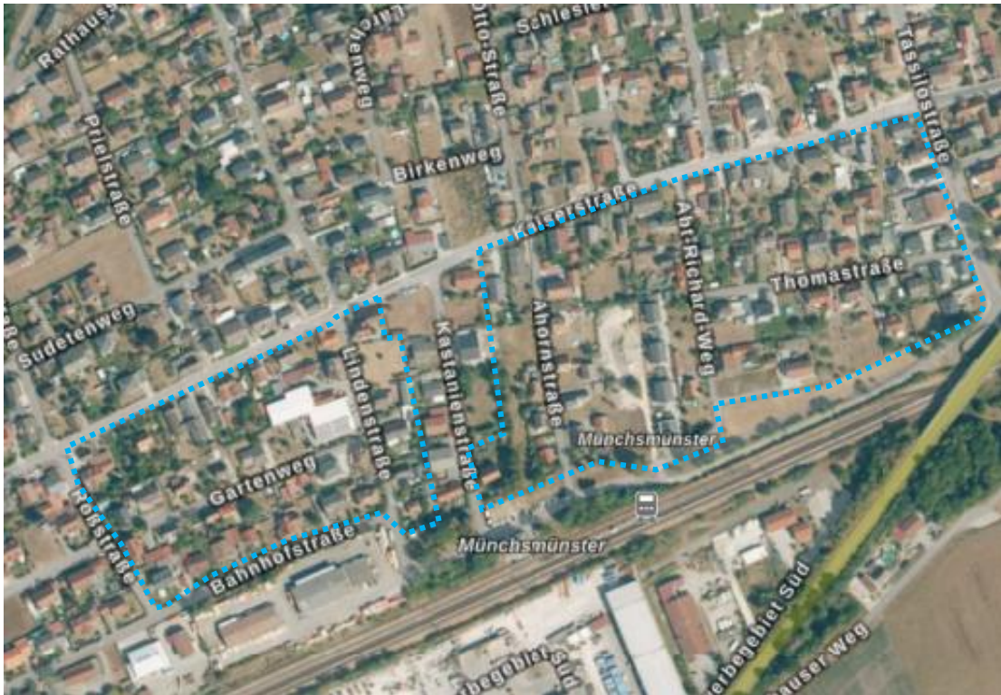
Abb. 1: Luftbild mit ungefähre Abgrenzung des Plangebiets 1

Die Siedlungsstruktur ist gekennzeichnet von Einzelhäusern auf großzügigen Grundstücken mit Privatgärten. Einzelne Verdichtungsansätze mit Doppelhaus-Bebauung oder Mehrfamilienhäuser sind erkennbar.