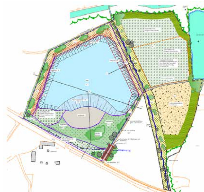
Plan: Firma Schweiger

Zum Kiesabbau wurde jetzt der Rekultivierungsplan der Firma Schweiger für die Fläche Griesham Weiher dem Gemeinderat vorgelegt.